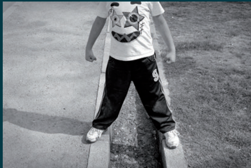
ARCO DE PROBABILIDAD S/T

A luz é a materia primixenia sobre a que o fotógrafo fabrica as súas ilusións; constrúe coa axuda do tempo unha imaxe que se converte instantaneamente en «pasado». Existe un terceiro factor inerente á fotografía, ás veces buscado, ás veces encontrado: o azar. Na fotografía química, as imaxes fórmanse nos negativos, que non son outra cousa ca haluros de prata dispostos azarosamente nun papel de acetato. Por ese motivo, é imposible que dúas imaxes fotoquímicas sexan completamente idénticas. Algo que ten máis importancia do que parece na nosa percepción dunha imaxe. A serie Arco de Probabilidade fala da relación da fotografía co azar, do azar coa natureza; e da natureza, con ser humano. O termo tamén fai referencia a un concepto técnico que teñen todas as cámaras fotográficas.