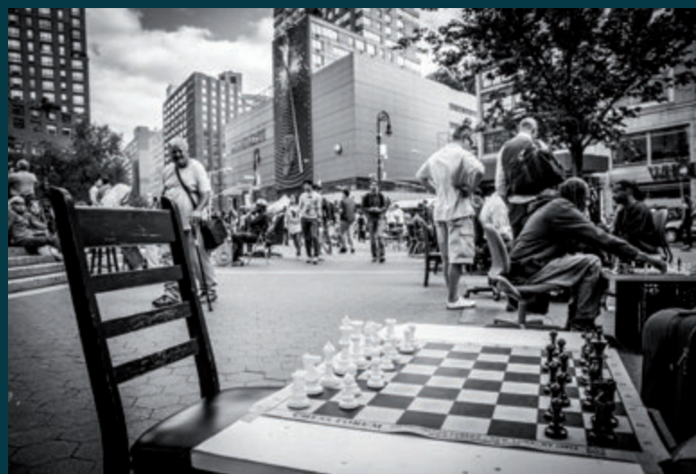
THE CITY Chess Forum

O enxame humano da cidade é enorme, mais os seus individuos en moitas ocasións viven illados, perdidos nese espazo esmagador. Son apenas elementos incorporados nunha realidade estraña.