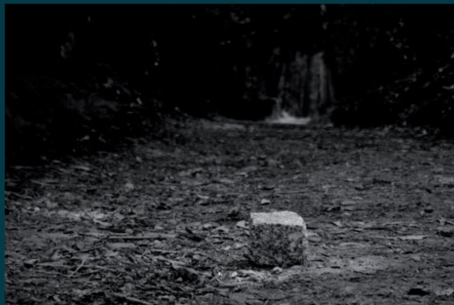
RUTAS CAUTIVAS Rutas cautivas III

Ao asumir o obstáculo, sobrepasalo e, quizais, conseguir deixalo atrás é onde un mesmo encontra a autenticidade dese camiño interior. A aceptación, a verdade.