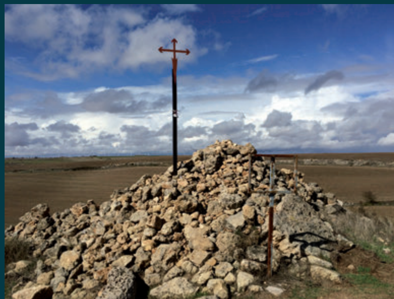
SIN PUERTAS Cruz, catro son as direccións do planeta; que a paisaxe, o pentagrama centre a mirada

Avanza, camiña e fixa na súa memoria lembranzas imposibles de borrar. A terra vaise facendo camiño diante dos seus pasos, o vento sopra sempre nas súas costas, o sol brilla cálido sobre a súa cara. Nada ata o seu corazón. Verdadeiramente, non se lle poden poñer portas ao monte! Momentos máxicos, cheos de benestar, tranquilidade, ensimesmamento e, por que non dicilo, de ledicia. Intenta captar instantes dunha vivencia chea, irrepitible, de pura liberdade, en definitiva... SEN PORTAS.