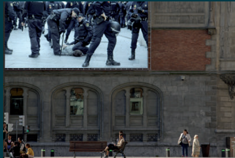
OFFSET estado policial 1

Mostrando a violencia sistémica sobre a que se sustenta a ideoloxía neoliberal, trastoca a significación do espazo físico e abre un umbral á disensión.