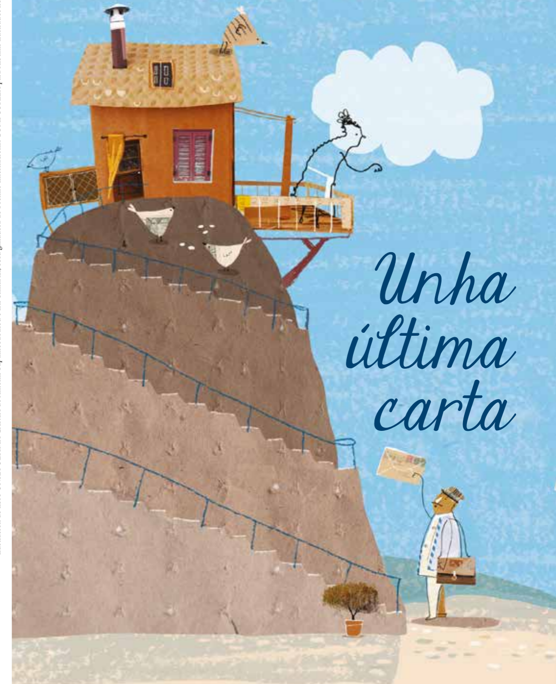
Ilustración do libro UNHA ÚLTIMA CARTA de Antonis Papatheodoulou e Iris Samartzis, obra gañadora do Premio Internacional COMPOSTELA para Álbums Ilustrados no ano 2016