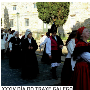
XXXIV DÍA DO TRAXE GALEGO

XXXVIII CONCURSO DE CIPRINIDOS "FESTA DO ESCALO" en Chaián