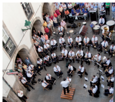
Banda Municipal de Música

12:00 h. Concerto Banda Municipal de Música Rúa do Vilar