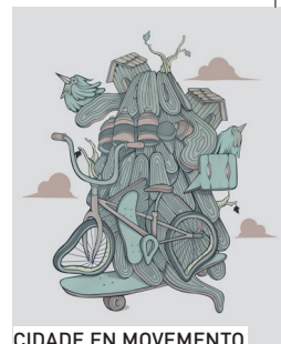
CIDADE EN MOVEMENTO

De 11:30 h. a 21:30 h. Cidade en movemento na Cidade da Cultura: Skate, BMX, Graffiti, Surf mecánico, Break dance, Minikarts, Exhibicións, teatro, xogos e obradoiros para gozar en familia da cultura urbana Organiza: Cidade da Cultura