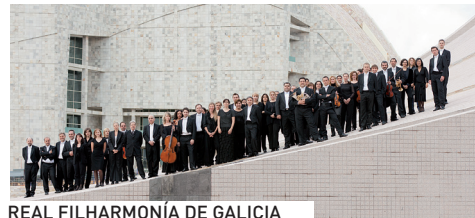
REAL FILHARMONÍA DE GALICIA