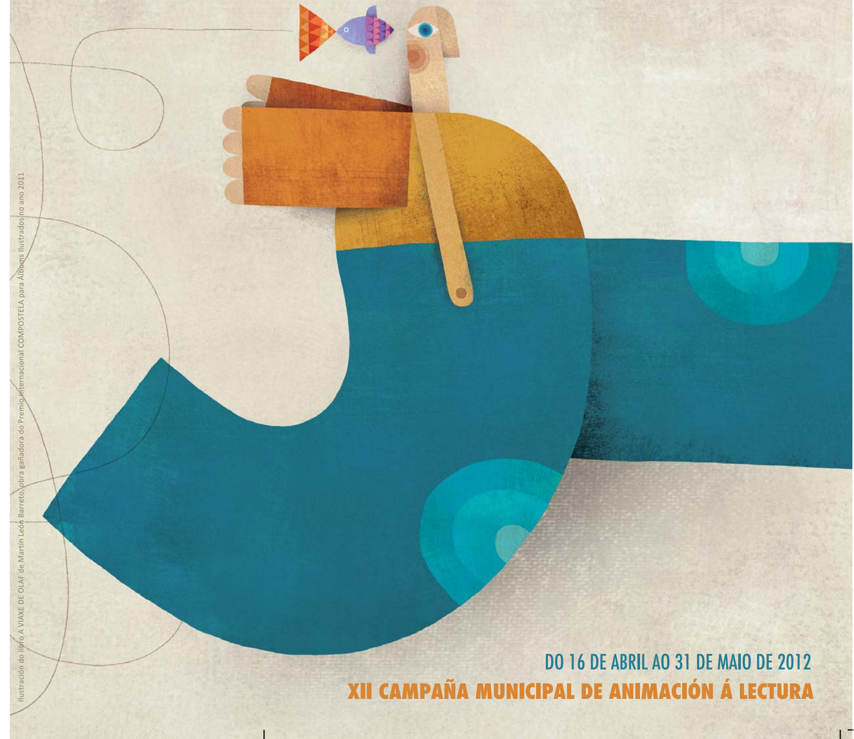
Ilustración do libro A VIAXE DE OLAF de Martín León Barreto, obra gañadora do Premio Internacional COMPOSTELA para Álbums Ilustrados no ano 2011.