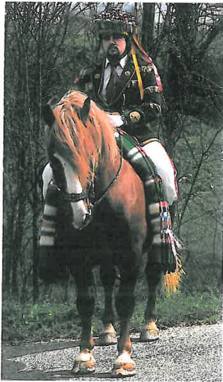
Correo (à esquerda) exeneral (à direita) no Entroido de Vedra. A Coruña