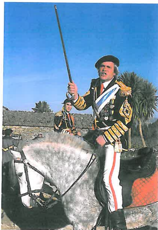
Xeneral da Ulla lanzando un "viva". Santeles. A Estrada. Pontevedra.