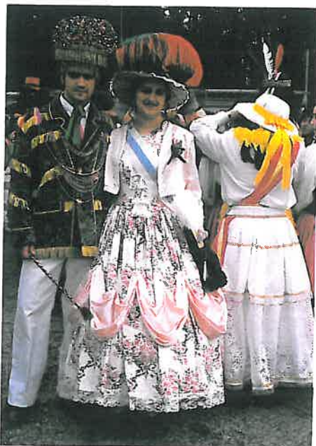
Tres detalles da vestimenta ornamentación de persoas e animais no Entroido de Reis. Teo. A Coruña.