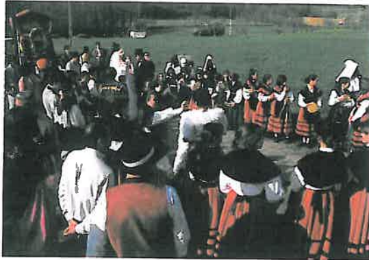
Coro no Entroido de Oza. Teo. A Coruña.