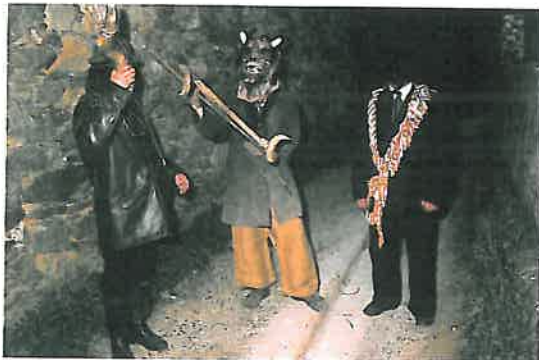
Mascarada no Entroido de Merza. Vila de Cruces. Pontevedra.