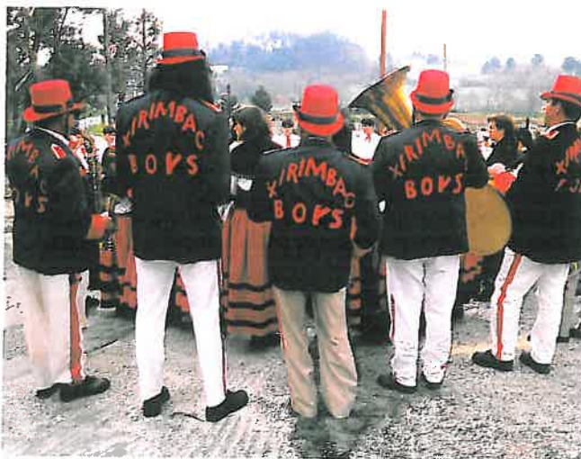
Charanga durante o Entroido de Reis. Teo. A Coruña.

F.—“Coro de vellos”. É o máis semellante a un Entroido convencional de toda a mascarada. Visten zalastranamente, ás veces cobren as caras con caretas e, nalgúns parroquias, imitan oficios como o de limpabotas, médico, sacamoas, gardas, etc.