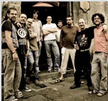
A BANDA DAS CRECHAS