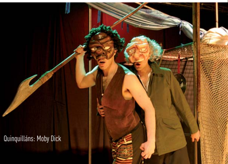
Quinquilláns: Moby Dick