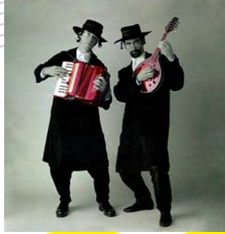
The Jews Brothers Band

(funky folk yiddish, klezmer e swing xitano) (Nova Zelanda)