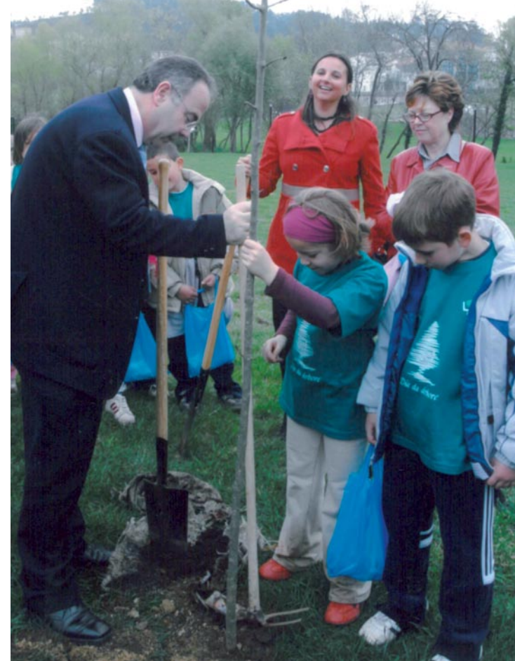
Día da Árbore cos nenos

Por exemplo o AVE, que vai ser o proxecto que máis vai contribuír a transformar a vida da cidade. Vai ter unha influencia decisiva porque consolida a Santiago como punto nodal das comunicacións de Galicia. Vai supoñer un cambio que hoxe é difícil de imaxinar. Máis alá de que chegue en 2012, como esperamos, ou en 2013, ou en 2014 –porque tampouco vexo ningunha razón para que se demore máis diso– é evidente que Santiago quedará convertido no punto central das comunicacións entre todas as cidades de Galicia, a 25 minutos de Coruña, a 35 de Vigo, a 21 de Ourense, a dúas horas e media de Madrid... Iso vai ser un cambio radical. Hai que entender que Santiago de Compostela tiña cinco estacións de tren: A Susana, Laraño, Berdía, A Sionlla e a estación actual. E mesmo chegamos a ter seis estacións cando aínda funcionaba a de Cornes. Agora, para o AVE prográmanse catro estacións en toda Galicia e en realidade estacións AVE de verdade só dúas, que son Ourense e Santiago. Iso vai supoñer unha revolución que converterá a nosa cidade no punto central de comunicacións