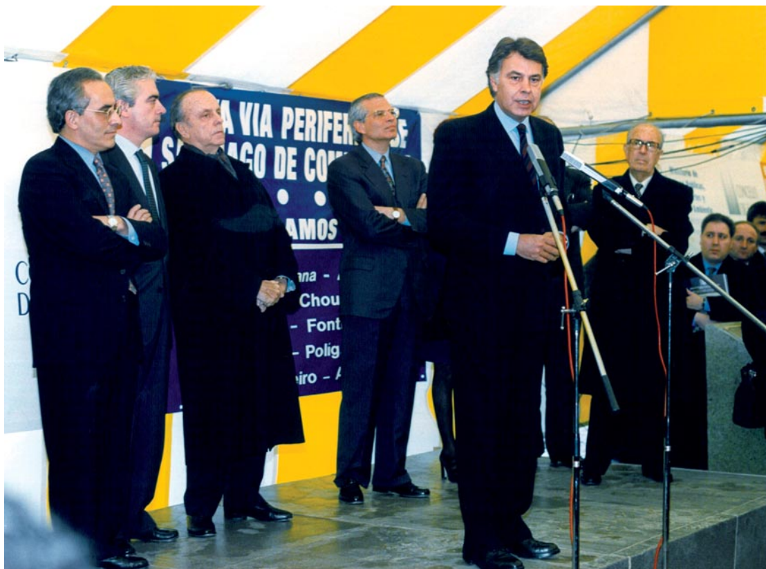
Inauguración do Periférico