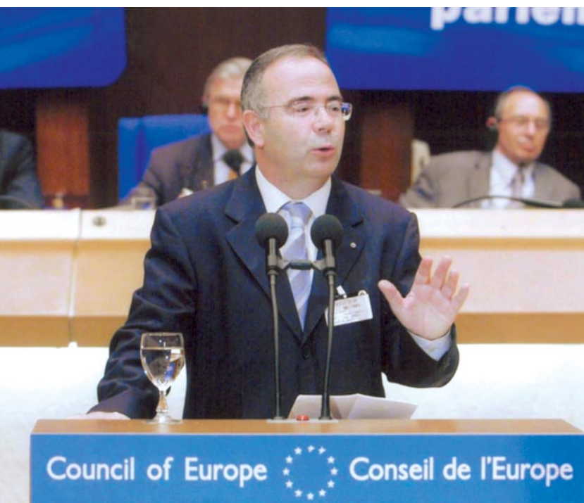
Intervención no Consello de Europa

Ser alcalde ten moito de sacrificio persoal. Esixe