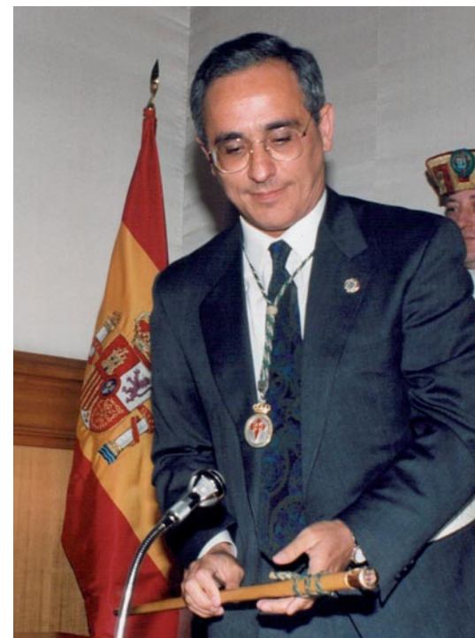
Toma de posesión

porque foi un tempo moi inestable e non tiña maioría absoluta, foi o momento da moción de censura, da que prefiro non falar, porque hoxe en día son os meus amigos, e é un episodio que xa pasou. En 1989, coa maioría absoluta, tivemos claro: Santiago necesita tres patas, un Plan Xeral, estruturas administrativas superiores ao Concello, que é cando nace o Consorcio, e, a terceira pata, o Camiño de Santiago. Eu tiña o interese polo Camiño desde a primeira corporación, e montamos o triunvirato de Marcelino Oreja, Javier Solana e eu. Tanto é así, que cando eu deixo a alcaldía pola moción de censura, o Ministerio noméame asesor para toda España do Camiño de Santiago, e facemos un libro que agora quero publicar, entre Serafín Moralejo, Manuel Díaz e Díaz, José Carlos Val, Fernando López Alsina e José Carlos Sierra. Facemos un libro no que afrontamos desde distintas facetas para tratar de explicar como había que entender no século XXI o Camiño de Santiago. Imos desenvolvendo plans estratéxicos e situándoos en función dos anos santos para desenvolver as directrices urbanísticas e económicas do Plan Xeral.