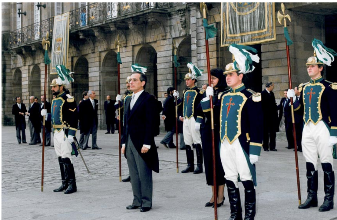
Delegado rexio no Día do Apóstolo

O Palacio de Congressos, o Auditorio, o periférico ou o hospital non estaban onde se lle ocorreu ao alcalde, senón onde o Plan Xeral dicía que debían de estar. Cando iamos vernos cos de Madrid ou con Fraga e cando nos preguntaban que queredes facer, podíamos dicir quero isto. E para conseguilo montamos un lobby que tiña dúas partes: unha era directamente Felipe González, Javier Solana e Pepe Borrell, a Moncloa, directamente implicada, e a outra unha relación institucional con Fraga realmente excelente. Como Fraga –criticaban os seus– fai o que lle di o alcalde? E Fraga supoño que pensaría por que o Concello é o que me trae as propostas máis razoables. Eran un lobby nacional, outro autonómico e outro internacional. Eu empecei a viaxar por toda Europa, a percorrer o Camiño á inversa, de Santiago cara a Estrasburgo, de Santiago a... Póñoome en relación e en contacto con todas as cidades europeas, vou a Perugia, a Pistoia, a Parides, Bruxelas, Oslo, Estocolmo. E tamén, coa ponte americana, co grupo de cidades co topónimo Santiago. Foi unha época dunha grande intensidade cultural, política, institucional, humana, porque o factor humano inflúe moitísimo.