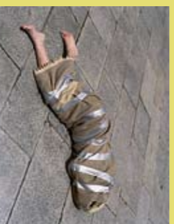
Maldita Europa, de Xurxo Oro Claro