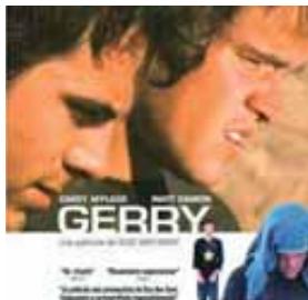
Gerry Matt Damon Gerry Casey Affleck