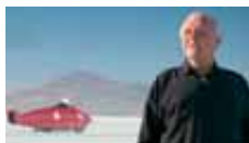
Anthony Hopkins Diane Ladd Paul Rodriguez Aaron Murphy Annie Whittle